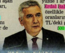
ISO Başkanı Erdal Bahçivan

Faizdeki düşüş ve yeniden yapılandırılmaların etkisiyle ISO 500 'ün finansman giderileri geçen yıl yüzde 33.4 düşüşle 64 milyar liraya indi. ISO 500 'de kâr eden kuruluş sayısı 381'den 411'e yükselirken, ISO 500 'ün istihdamı da 2019'da yaklaşık yüzde 1 arttı. ISO Başkanı Erdal Bahçivan , "2019'un özellikle ikinci yarısında, faiz oranlarındaki düşüşler ile TL 'deki görece istikrar, ISO 500 için 2018'e göre daha olumlu mali koşullar yarattı" dedi.